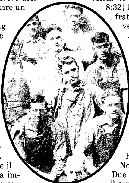
Al centro, con altri beteliti 1920